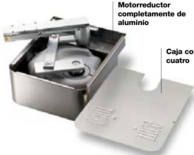
Motorreductor completamente de aluminio

Metro, motorreductor electromecánico irreversible para puertas batientes. Montaje enterrado. MetroPlus, 24Vcc, con encóder magnético.