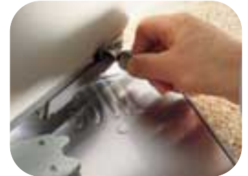
El desbloqueo Nice, elegantemente protegido, cómodo y fácil de accionar con una sola mano

• funcionamiento incluso si falta corriente con baterías recargables