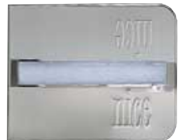
La caja de cimentación, compacta y autoportante, en la versión de acero inoxidable