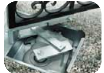
Compacto y elegante, Metro se inserta con la discreción máxima en cualquier arquitectura