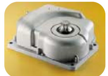
El motorreductor estanco: robusto, hecho totalmente de metal